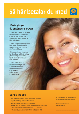
Affisch, 50x70 cm